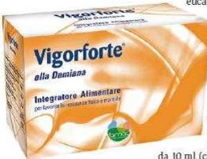
da 10 ml (confezione da 12).

Nella linea di integratori specifici sviluppata da Fa.ma.e International (Tel. 0119715285), Vigorforte alla Damiana è il prodotto dedicato a contrastare lo stress e la stanchezza fisica e mentale. È indicato quando ci si sente affaticati e per chi ha un'intensa attività sia fisica sia mentale (sport, studio, lavoro), per gli anziani, nelle convalescenze e per stimolare la capacità di rispondere alle più varie situazioni di stress. Tra i componenti funzionali, il fitoestratto concentrato (1:4) di damiana svolge attività psicostimolante, migliorando le funzioni cognitive e il rendimento psicofisico; inoltre ha un'azione afrodisiaca, utile per l'impotenza maschile. L'efficacia dell'integratore va attribuita anche agli altri ingredienti presenti nella composizione: fitoestratto concentrato (1:4) di eleuterococco; fitoestratto concentrato (1:4) di Panax ginseng; miele di eucalipto, uno dei mieli più ricchi