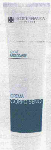
PER IL SENO Azione rassodante: Crema Corpo Seno di Mediterranea (150 ml, € 15,60).