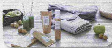
ALLE FRAGOLE Maschera per illuminare e rivitalizzare con fragola e mirtillo: Berryfina di Repêchage (90 ml, € 37).

Fino a sabato 8 aprile, sarà possibile prenotare i trattamenti professionali corpo Body Strategist di Comfort Zone, in versione express (30 minuti) e a un prezzo speciale di € 25. L'elenco completo dei centri aderenti all'iniziativa su: comfortzone.it