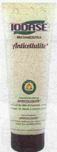
ANTICELLULITE Con Tè Verde: Crema Anticellulite di Iodase Biocosmeceutica (€ 37,70).

CURARE LA PELLE, COMBATTERE LA CELLULITE, MA ANCHE DETERGERE VISO, CORPO E CAPELLI POSSONO DIVENTARE GESTI RISPETTOSI DELL'AMBIENTE. CON I PRODOTTI GIUSTI