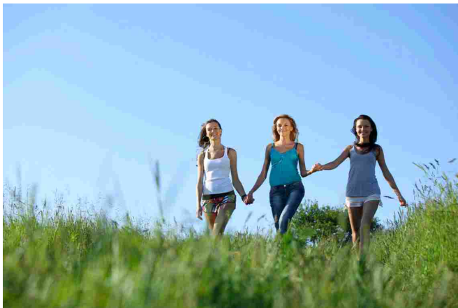
Movimento ed uso costante del prodotto danno buoni risultati

Come già accennato la profumazione è molto delicata e poco invadente, non interferisce assolutamente con il vostro eventuale profumo abituale. Il consiglio è di utilizzarlo per almeno un mese , ma si può tranquillamente continuare l'applicazione dello spray anche per più tempo. Più a lungo verrà applicato e più i benefici saranno visibili . Suggestivo inoltre di associare, nel periodo di applicazione, una bella camminata di circa 20/30 minuti, anche saltuariamente, o comunque di seguire una vita meno sedentaria possibile. L'uso costante dello Spray cellulite e snellimento e un po' di movimento in più vi daranno ottimi risultati!