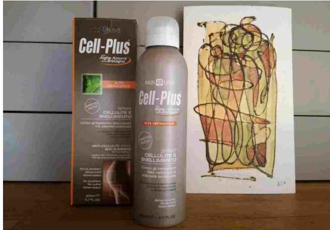
Lo spray cellulite e snellimento della linea Cell-Plus

Si tratta di una comoda soluzione spray, con erogatore multidirezionale per facilitarne l'applicazione. Il prodotto è fluido, simile ad un latte, con una profumazione delicata e gradevole, caratterizzato da un'estrema velocità di assorbimento.