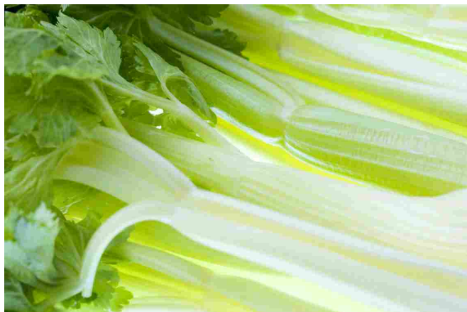
Il sedano per un'azione drenante e di protezione delle vie urinarie

In questa formula, davvero molto efficace, troviamo sedano e ananas che hanno eccezionali proprietà drenanti . Il sedano inoltre protegge le vie urinarie mantenendole efficienti e in buona salute. Il limone e il tè verde oltre a svolgere azione depurativa e diuretica, con il loro contenuto in polifenoli hanno azione antiossidante . Completano l'azione la pesca, le vitamine A ed E. Consigliata in tutte le situazioni in cui si soffre di ristagno di liquidi, sensazione di gonfiore e pesantezza degli arti inferiori .