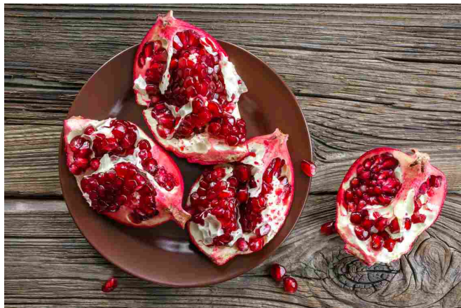
Melagrana per un'azione antiossidante