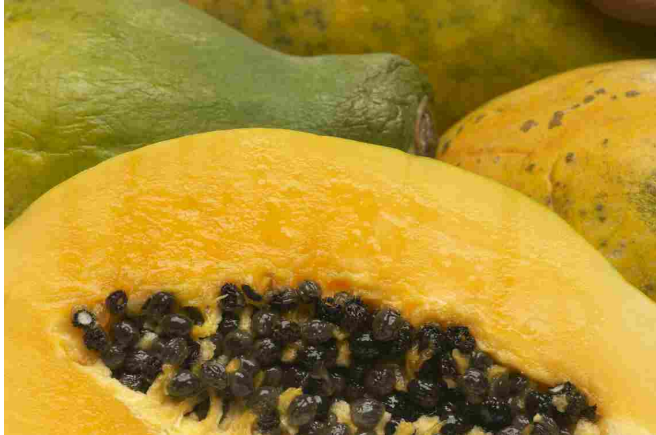
La papaya per sostenere la funzionalità del sistema immunitario

ad esempio in autunno per difenderci dai malanni della stagione invernale.