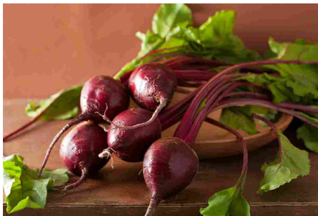
Quanta energia ci regala la barbabietola fresca!

Se abbiamo bisogno di una sferzata di energia, la formula tonificante è quella che fa per noi. Il guaranà, ricco in caffeina, ci tonifica mentre banana, fragola e barbabietola ci regalano un mix di importanti vitamine e minerali come potassio e magnesio. L'aggiunta di zinco, vitamina C e del gruppo B aiuta a sopportare meglio la stanchezza e migliora il metabolismo energetico. Centripura® tonificante è utile nei momenti in cui il lavoro, lo studio o l'attività fisica in genere richiedono maggiore energia o semplicemente quando ci sentiamo stanchi e affaticati.