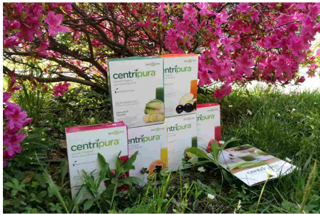
Centripura® Bios Line

Centripura® di Bios Line è una linea di integratori che offre i benefici di frutta e verdura, bilanciate con vitamine e minerali, in una forma piacevole come un concentrato fresco e pronto in pochi minuti. La tecnologia produttiva usata per gli estratti integrali di frutta e verdura di Centripura® ha permesso di mantenere inalterate gusto, profumo e proprietà nutrizionali degli ingredienti freschi utilizzati , con il vantaggio di essere pronti in un attimo: basta avere a portata di mano un bicchiere di acqua naturale e una bustina di Centripura®, e in un attimo avrete pronto il vostro concentrato di frutta e verdura da bere.