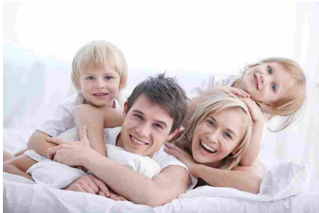
Una formula detergente per l'uso quotidiano deve essere delicata e piacevole per tutta la famiglia

alla prova una formula bio, adatta a tutta la famiglia, ricca di attivi vegetali e con oli essenziali , perché anche il profumo è importante.