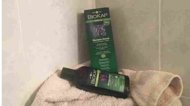
BioKap® shampoo doccia certificato naturale e biologico

scheda e ho subito notato la certificazione bio di EcoCert Greenlife; ma ciò che mi ha fatto venire voglia di provarlo è stata la promessa di una pelle morbida e di capelli voluminosi e lucenti : il mio sogno!