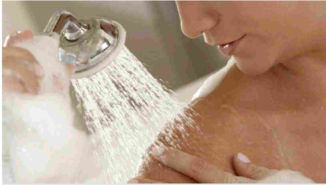
Il momento della doccia quotidiana diventa una pausa rilassante