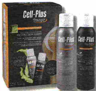
La confezione e i flaconi di Mousse Croccante Anti-Cellulite Corpo della linea Cell-Plus di Bios Line.

Mousse Croccante Anti-Cellulite Corpo della linea Cell-Plus di Bios Line è un trattamento contro la cellulite composto da un prodotto da usare di giorno e un altro da impiegare la notte. Entrambi, dopo l'applicazione, sviluppano migliaia di bollicine che svolgono un efficace micromassaggio: in questo modo diventano più efficaci le sostanze rimodellanti e rassodanti che combattono la cellulite.