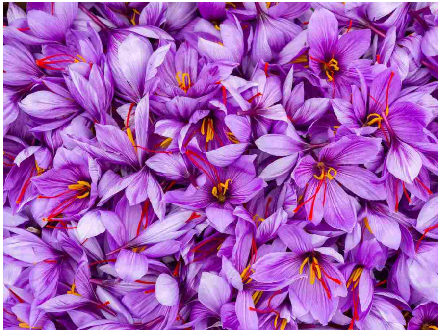
Fiori di Zafferano

RISINCRONIZZA L'OROLOGIO BIOLOGICO. Guarda caso, lo zafferano dà più gusto anche alla linea Arkéskin dei Laboratoires Lierac , routine cosmetica lanciata nel 1996 per prendersi cura "in & out" della pelle in menopausa e fresca di riformulazione. La platea delle sue potenziali consumatrici è nutrita: nel 2019 le donne in menopausa erano 10 milioni solo in Italia, e si prevede che entro il 2025 saranno più di un miliardo in tutto il mondo. La ricetta elaborata con la collaborazione di Cristina Maggioni, ginecologa ed esperta internazionale di cronobiologia, è pronta a supportarle, senza ricorrere a fitoestrogeni. «La menopausa non è altro che una desincronizzazione dell'orologio biologico», spiega l'esperta. «In quel delicato periodo, il calo dei livelli ormonali fa perdere alle cellule il corretto ritmo circadiano tra giorno e notte. Alterando la ripartizione delle attività di protezione e rigenerazione della pelle sulle 24 ore, ne accelera l' invecchiamento». Se il compito di risincronizzare l'orologio biologico per migliorare la barriera cutanea è affidato soprattutto a due biopeptidi contenuti in una crema giorno e in un fluido notte, spetta proprio all'estratto di zafferano riportare l' armonia generale. Lo fa sotto forma di un integratore alimentare, con ingredienti al 99,9 per cento di origine naturale. Aggiunto a selenio, oli di argan, camelina, enotera e alle vitamine D e B9, la super spezia crea una sensazione di benessere globale, che fa dimenticare l' età.