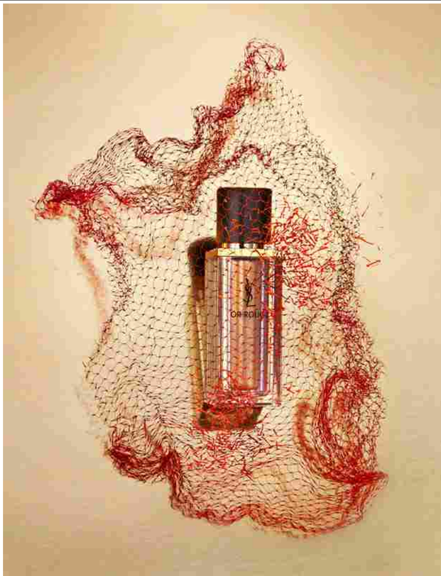
Zafferano Anti-Age: Or Rouge Le Serum di YSL – Still Life Massimiliano De Biase

Zeta come zafferano. L'alfabeto del benessere si recita al contrario. La spezia very luxury (può arrivare a costare fino a 60 euro al grammo), quella che tinge d'oro tutto ciò che incontra, immancabile nelle dispense di ogni master chef, si appresta a conquistare anche i ripiani di profumerie e farmacie. Le sue proprietà cosmetiche , in particolare antiossidanti e racchiuse negli stimmi e nei petali dei fiori, ne fanno l'ingrediente più cool del momento. È vero, gli Antichi si erano già accorti delle sue qualità: gli Egizi lo impiegavano, non solo per aromatizzare le pietanze, ma anche come base di oli e profumi; i Greci offrivano l'oro rosso in dono alle divinità femminili per le sue proprietà ringiovanenti, come testimoniano alcuni affreschi ritrovati sull'isola di Santorini (datati 1627 a.C.) e le più vecchie coltivazioni di Creta. Anche la Roma Imperiale faceva largo uso del safranum (dall'arabo za'farān, giallo) per tingere i capelli e contrastare gli sbalzi d'umore.