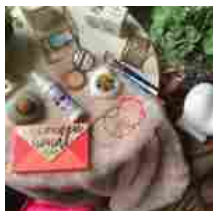
MYBEAUTYBOX Ottobre 2019 WOWBOX