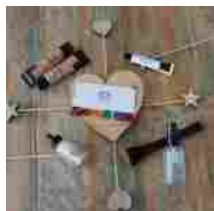
The Body Shop Make Up 100% Vegan and Cruelty Free