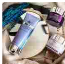
Beauty Routine:Prai Beauty